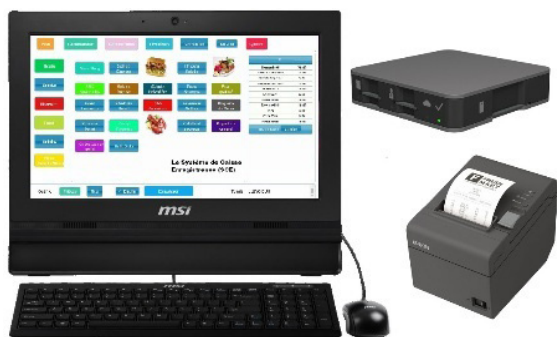
Resto Starter Pack