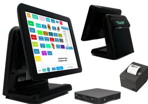
Resto Premium Pack