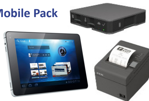
Resto Mobile Pack