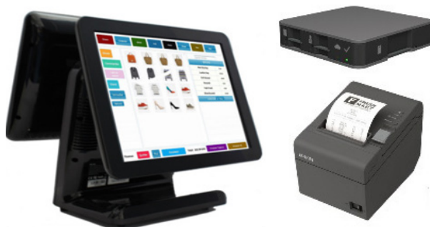
Resto Premium Plus Pack